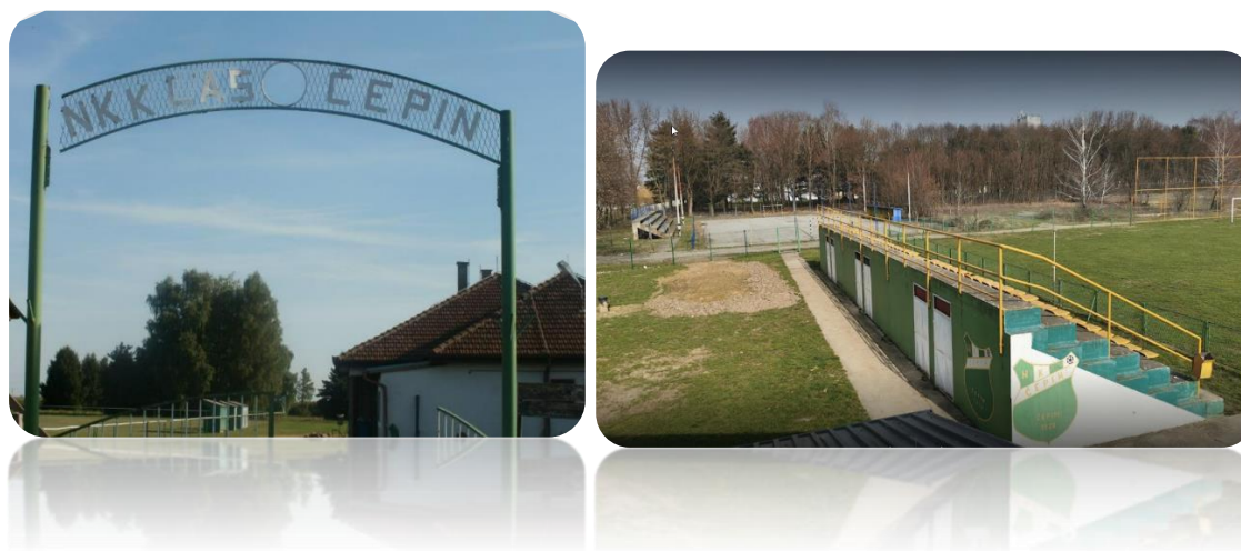
Slika 1. Stadion Klas, Slika 2. Stadion Čepin

Općina Čepin Odlukom o načinu upravljanja i korištenja sportskih građevina u vlasništvu Općine Čepin (»Službeni glasnik Općine Čepin« broj 04/20) uredila je način upravljanja i korištenja javnih sportskih građevina i drugih sportskih građevina u svom vlasništvu.