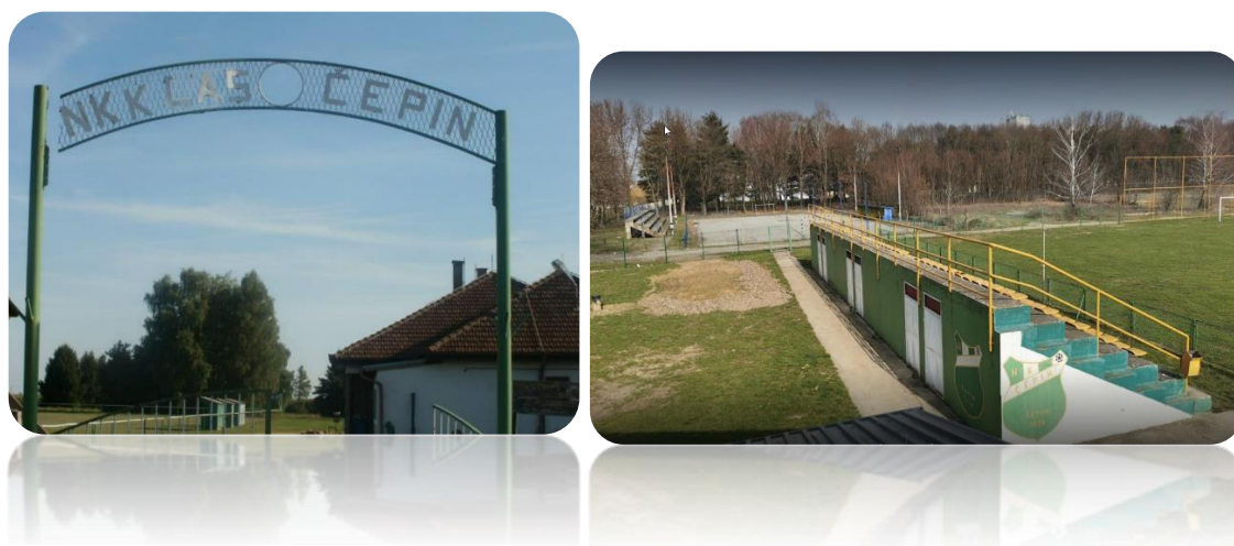
Slika 1. Stadion Klas, Slika 2. Stadion Čepin

upravljanja i korištenja javnih sportskih građevina i drugih sportskih građevina u svom vlasništvu.