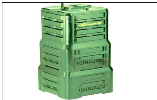
Slika 6: Posude za primarnu selekciju komunalnog otpada, komposter za kućanstvo

Općina Čepin planira slijedeće, a prema financijskim mogućnostima u najkraćim mogućim rokovima: