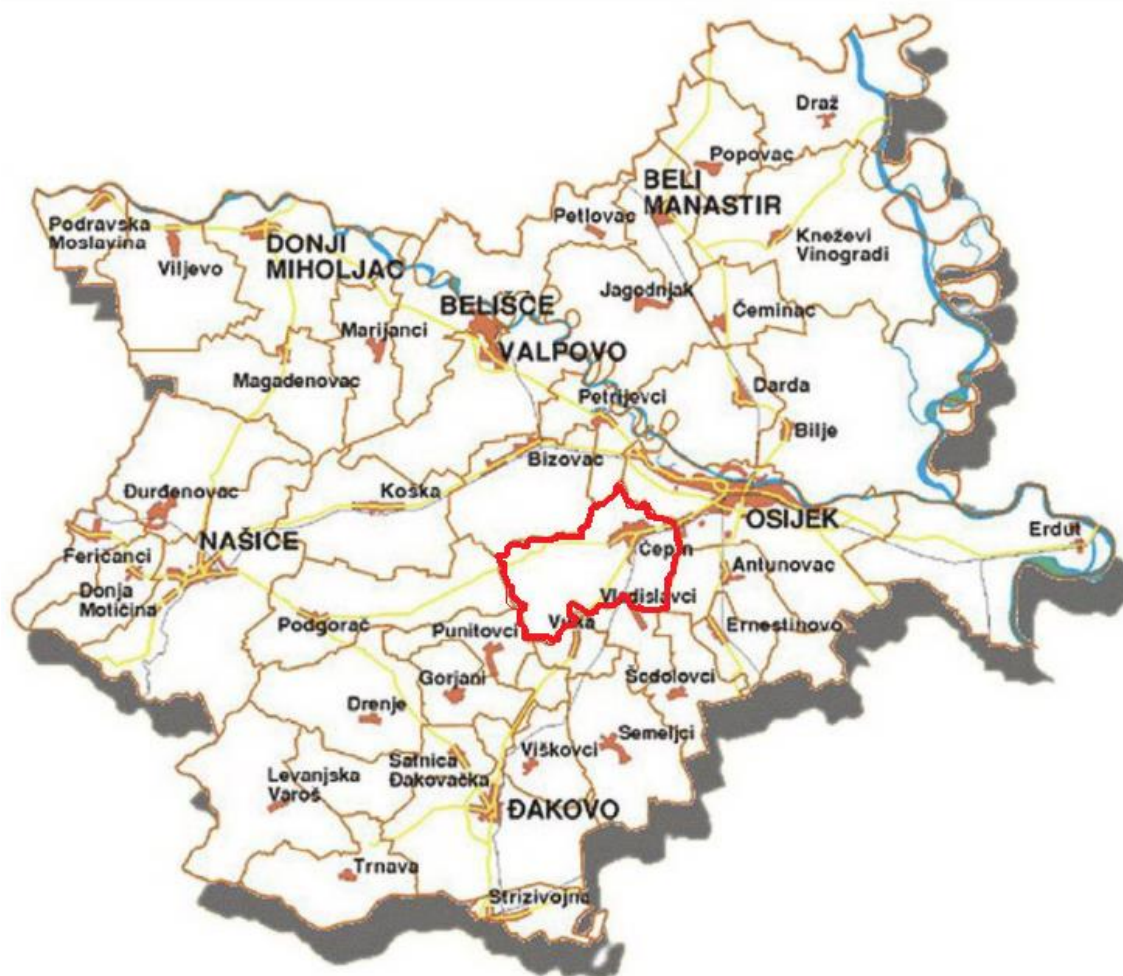
Slika 1: administrativne granice Općine Čepin unutar Osječko-baranjske županije

Status gradova imaju Osijek, Beli Manastir, Belišće, Donji Miholjac, Đakovo, Našice i Valpovo. Sjedište županije je u gradu Osijeku, koji je ne samo gospodarski, već i kulturni i obrazovni centar istočne Slavonije. Ima izuzetno povoljan zemljopisni položaj na rijeci Dravi i uz Dunav, koji je jedan od najznačajnijih europskih plovnih putova. Bogati prirodni resursi se temelje na sastavu tla i klimi pogodnoj za poljoprivrednu proizvodnju, termalnim vodama, očuvanom okolišu i zaštićenom području Kopačkog rita. Razvoj turizma županije počiva na lječilišnom, rekreativnom, lovnom i ribolovnom te seoskom turizmu.