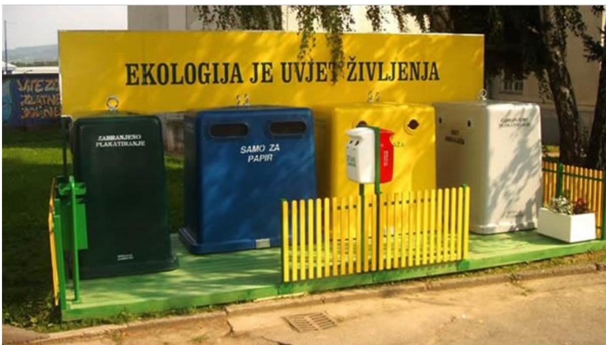
Slika 2: Primjer izvedbe zelenog otoka