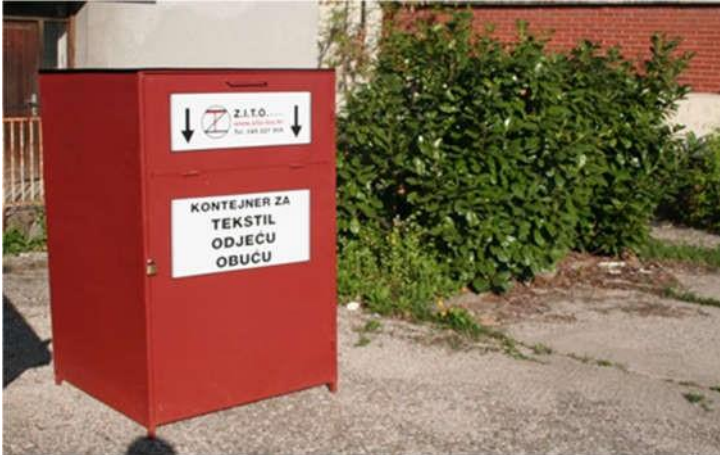
Slika 3: Izgled kontejnera za odvojeno prikupljanje tekstila i obuće